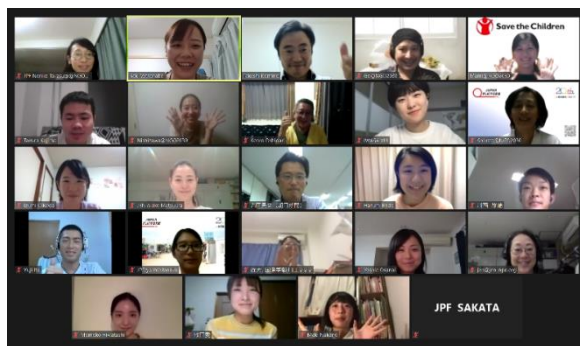
(イベントの終わりに撮影した集合写真)